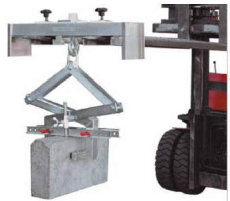
Zange & Stapler nicht im Lieferumfang